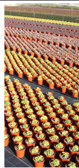
Les plants "aromatiques" ou "officinales" sont un patrimoine tout à découvrir et utiliser pour le développement économique du territoire.

L'attention pour la santé et le bien-être du consommateur, ainsi que la redécouverte et la valorisation des produits agro-alimentaires avec un grand passé et un probable future, ont nous invités à parcourir la pas simple vie de la valorisation et de