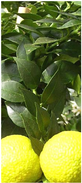
Le Chinotto ( Citrus myrtifolia ) est un agrume digne d'attention pour ses utilisations alimentaires.

La Méditerranée du Nord et les territoires de la Sardegnna, de la Corse, de la Liguria et de la cote de la Toscana sont les gardiens des grands trésors végétaux locaux, ou qui sont été importés par l'homme pendant migrations et transhumances millénaire. Aujourd'hui ils constituent la colonne vertébrale des traditions alimentaires et des productions ornementales de ce territoire, ainsi que la source - encore toute à découvrir - des substances important pour le secteur pharmaceutique.