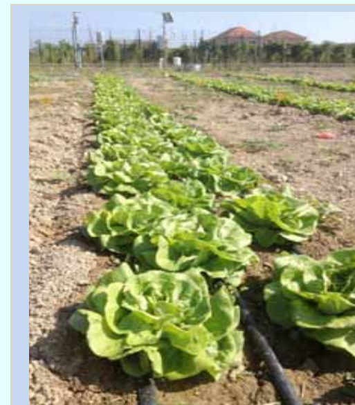
Prove di coltivazione di lattuga in campo presso il CERSAA

Le azioni di dimostrazione (5 e 6) sono state avviate ad aprile 2013 in Spagna e in Italia, dopo il completamento, rispettivamente, delle azioni 3 e 4. Il loro obiettivo è quello di dimostrare la fattibilità dell'applicazione di rifiuti trattati a coltivazioni in pieno campo e in serra.