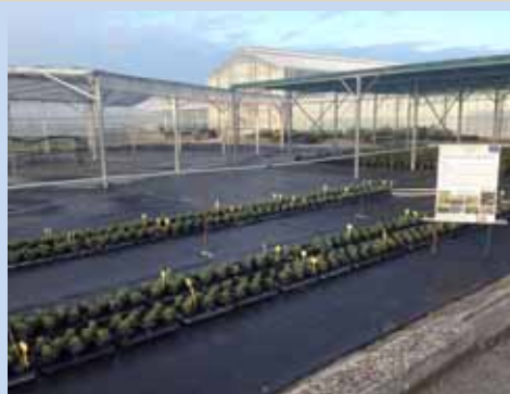
Prove di coltivazione di rosmarino in campo presso il CERSAA