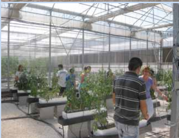
Campo sperimentale "Tres caminos" a Santomera (Murcia) – coltivazione in serra